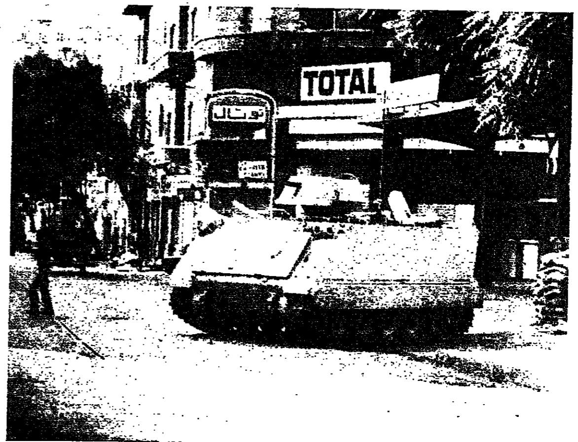
مصحة لقوى الامن قرب محطة خزالله على طريق فرن الشباك